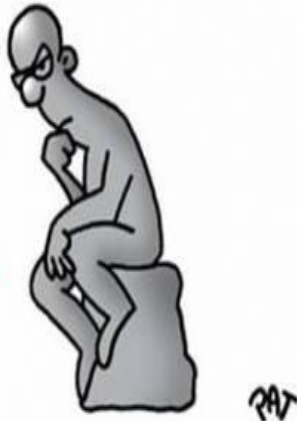
El Pensador Calvito

¿Y NO SERÁ QUE DESDE QUE PENÉLOPE CRUZ MENCIONÓ A ALCOBENDAS EN LA CEREMONIA DE LOS OSCAR, EL ALCALDE GARCÍA VINUESA CONSIDERA Poca cosa el solucionar los problemas de los vecinos? DE OTRA FORMA NO SE EXPLICA QUE UTILICE UN PLENO MUNICIPAL PARA IR A POR ZAPATERO